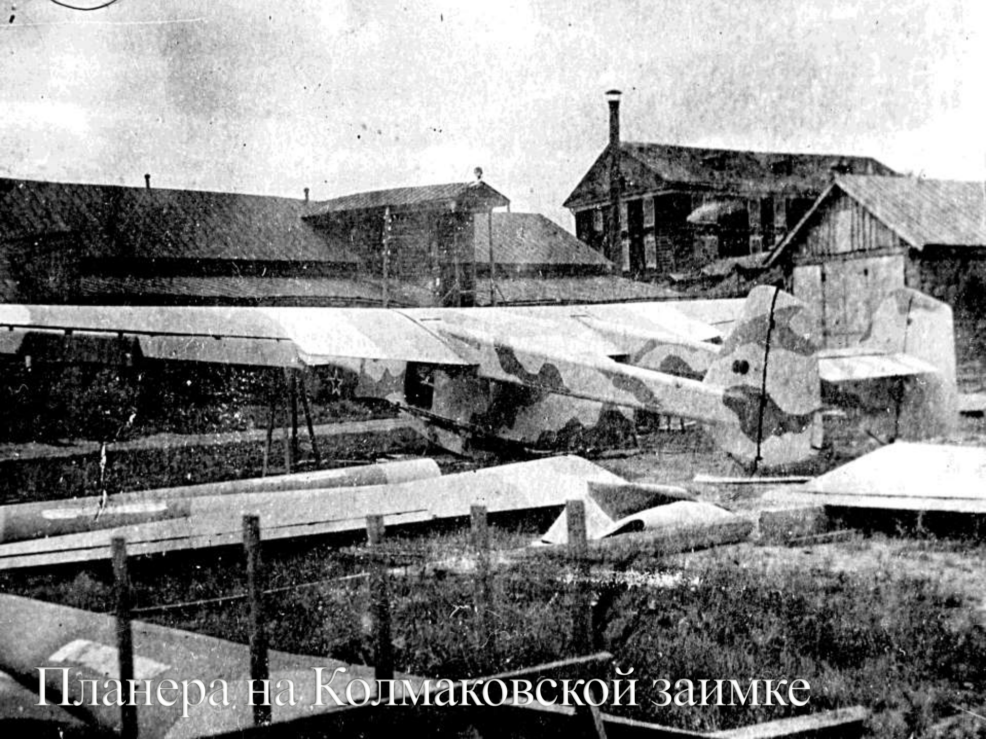
Планера на Колмаковской заимке