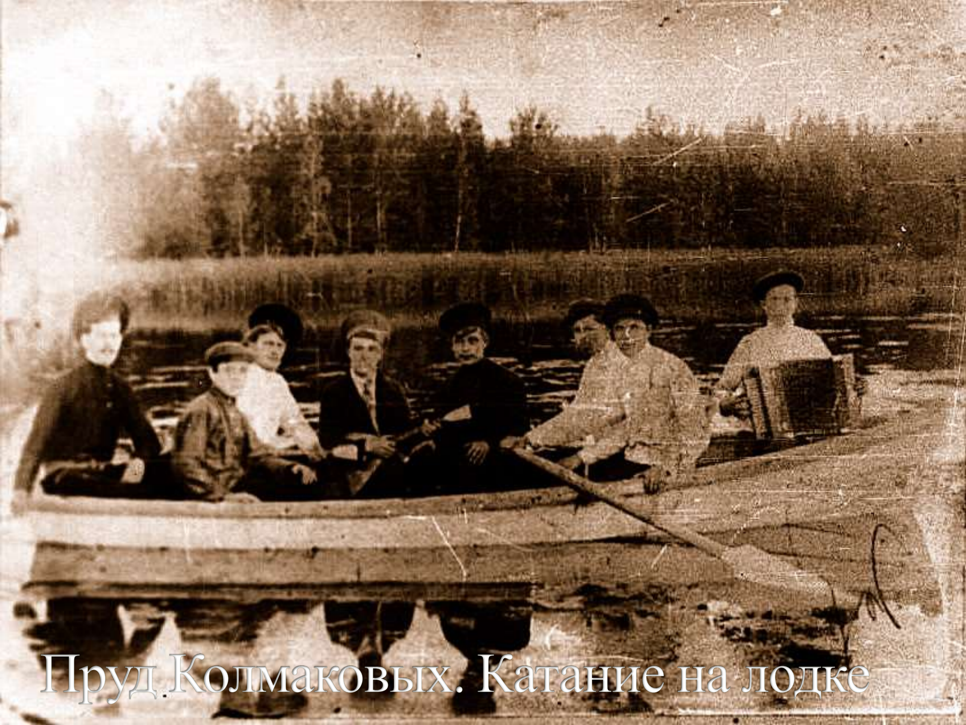
Пруд Колмаковых. Катание на лодке