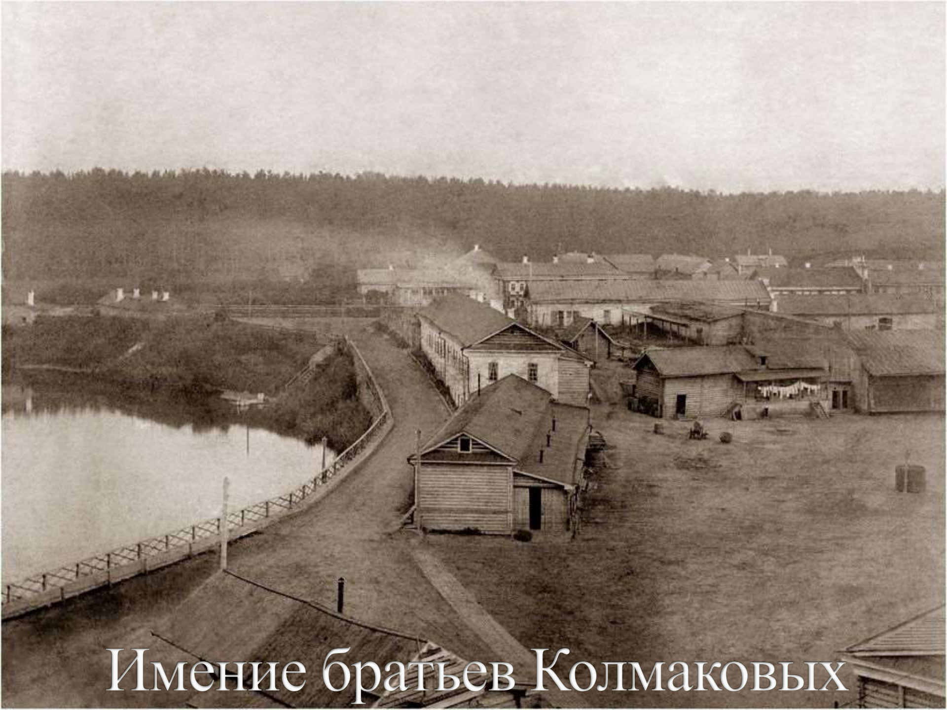
Имение братьев Колмаковых