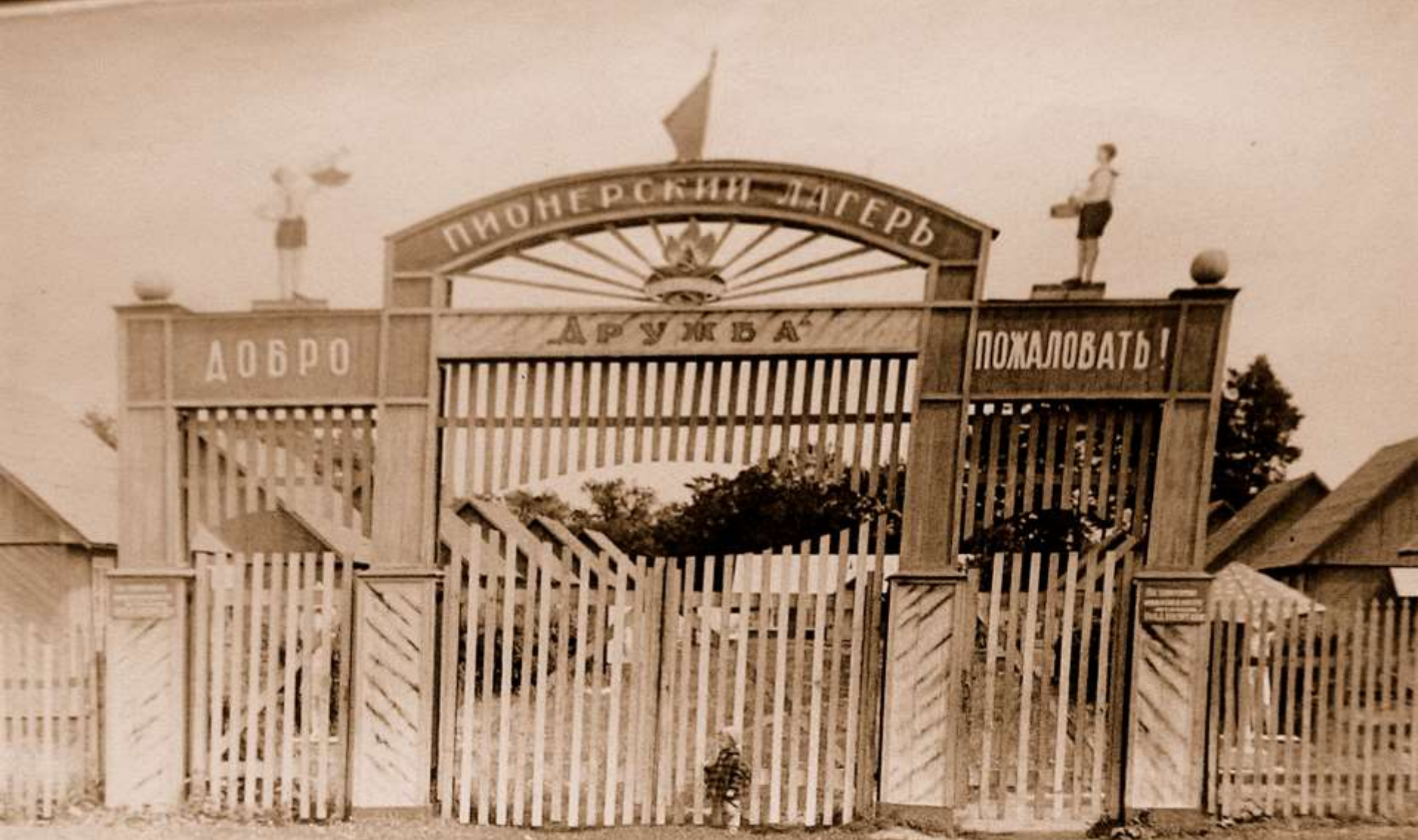
Пионерский лагерь «Дружба»