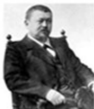
Савва Тимофеевич Морозов