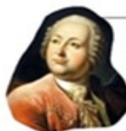
Михаил Васильевич Ломоносов